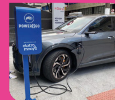
Carregador de carro elétrico