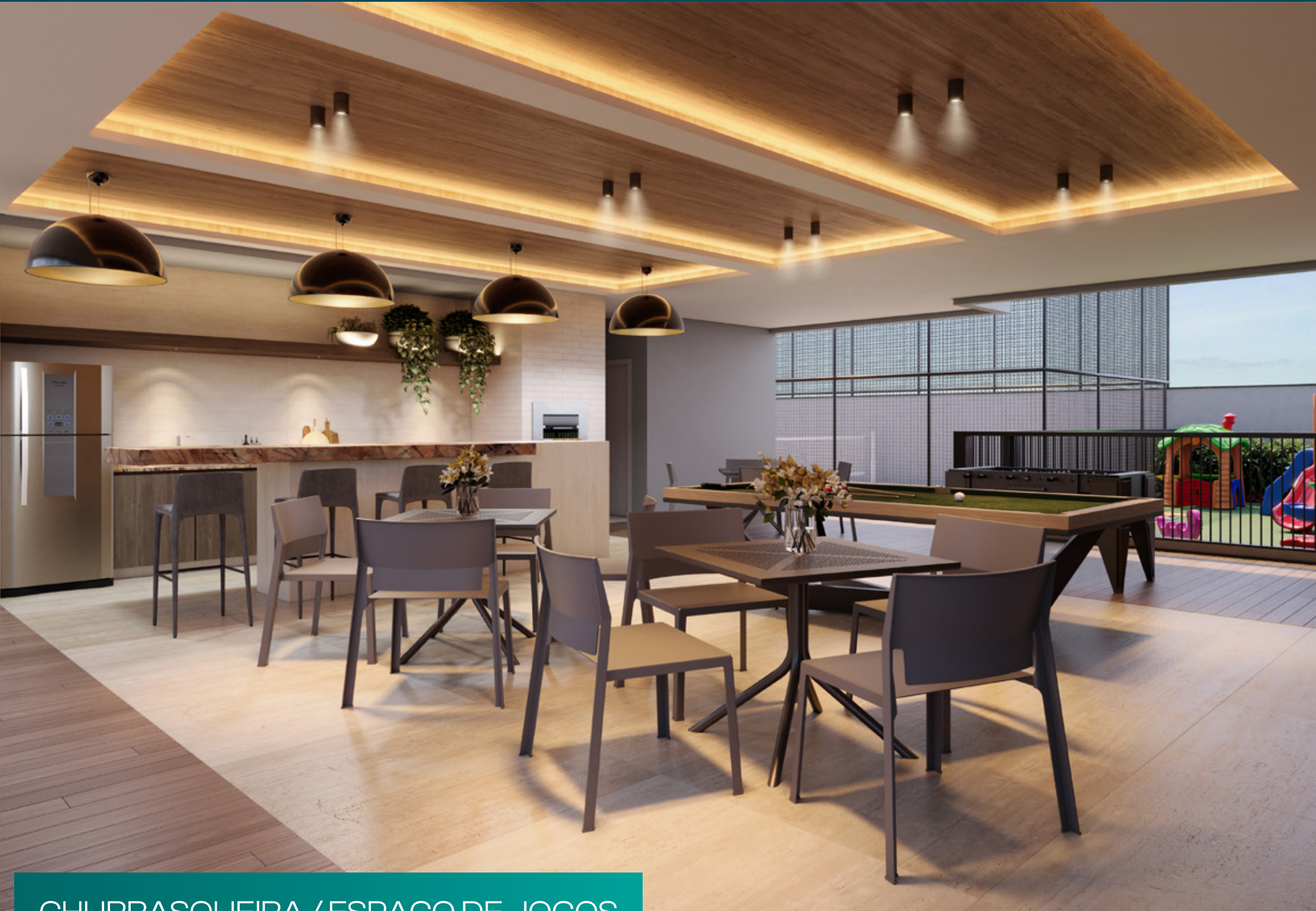
CHURRASQUEIRA / ESPAÇO DE JOGOS