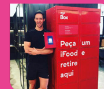
Box de comida iFood