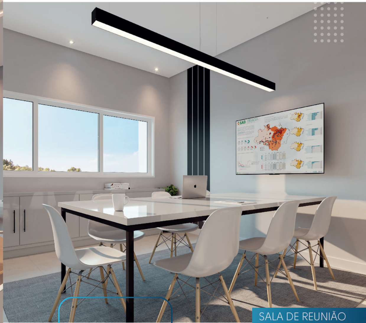
SALA DE REUNIÃO