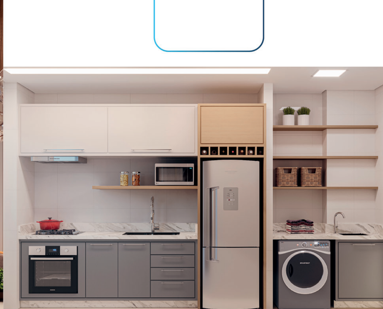
COZINHA | ÁREA DE SERVIÇO